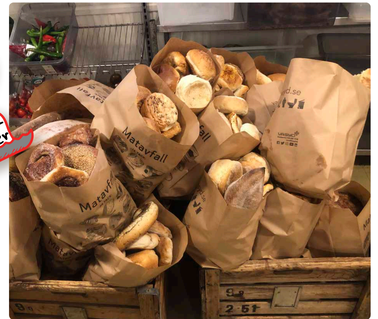
Varje dag skördas mängder av bröd i de butiker som Matbanken besöker.

Nya EU-regler innebär dryga böter för matavfall.