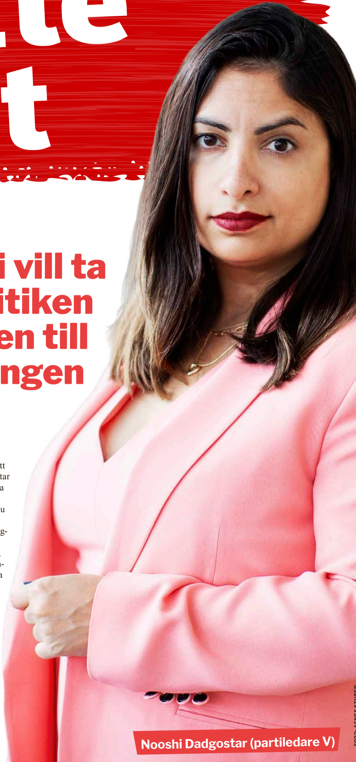
Nooshi Dadgostar (partiledare V)